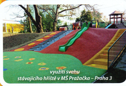
využití svahu stávajícího hřiště v MŠ Pražanka – Praha 3