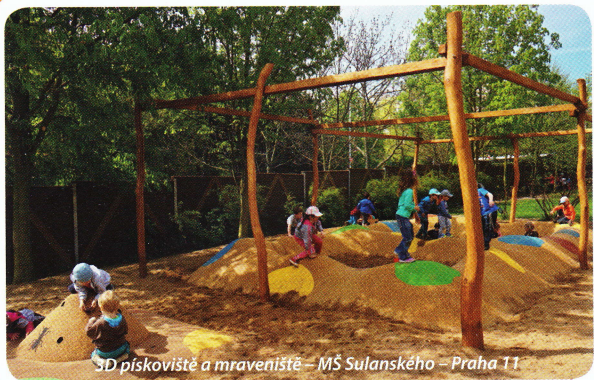
SD pískoviště a mraveniště – MŠ Sulanského – Praha 11

Čas trávený na čerstvém vzduchu by měl sloužit k vybití přebytečné energie dětí a podporovat přirozený pohyb. Na druhé straně mají učitelky v MŠ velkou odpovědnost za bezpečnost svěřených dětí. Jak tyto dva aspekty skloubit? Může být zahrada u vaší MŠ proměna v atraktivní herní plochu, která aktivně vybízí ke hře a zároveň zvýší bezpečnost pohybu dětí venku? Existuje řešení pro dětská hřiště, jež eliminuje úrazy vzniklé pádem, poskytuje celoroční využití a splňuje hygienické normy?