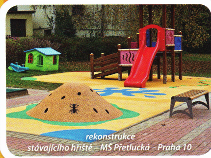
rekonstrukce stávajícího hřiště – MŠ Přetlucká – Praha 10

Podobnou zkušenost mají i v MŠ Hřibská: „Naše zahrada je vybudovaná na navázce a půda není velmi kvalitní. Zatravněné plochy byly velmi rychle vyšlapané nebo během prvních teplých květnových dní vypálené od slunce. Když zapršelo, děti byly celé od bláta. Ideální řešení znamenalo strhnout, navést novou hlínu, zatravnit. Hledala jsem nové řešení, které by nám vyhovovalo cenou, kvalitou, bezúdržbovostí, a narazila jsem na nabídku povrchů SmartSoft . V zahradě jsme používali kačírek. Poměrně vyhovující varianta, ale začalo nám to dělat problémy při údržbě zatravněných ploch a každé dva roky jsme jej museli doplňovat. Hledali jsme dlouhodobé efektivní řešení.“