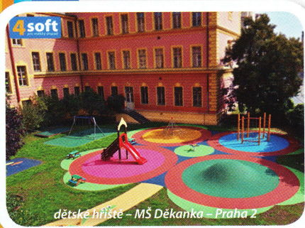
dětské hřiště – MŠ Děkanka – Praha 2

Čas trávený na čerstvém vzduchu by měl sloužit k vybití přebytečné energie dětí a podporovat přirozený pohyb. Na druhé straně mají učitelky v MŠ velkou odpovědnost za bezpečnost svěřených dětí. Jak tyto dva aspekty skloubit? Může být zahrada u vaší MŠ proměna v atraktivní herní plochu, která aktivně vybízí ke hře a zároveň zvýší bezpečnost pohybu dětí venku? Existuje řešení pro dětská hřiště, jež eliminuje úrazy vzniklé pádem, poskytuje celoroční využití a splňuje hygienické normy?