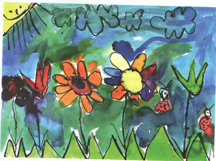
Obrázek z MŠ Horní Lideč

Některé školky organizují společné dílny. Každý týden mají rodiče možnost přijít a vyzkoušet si předem oznamovanou činnost spolu s dětmi. Je to například keramika, kreslení, zpívání, výroba okrasných předmětů. Střídají se dopolední a odpolední termíny.