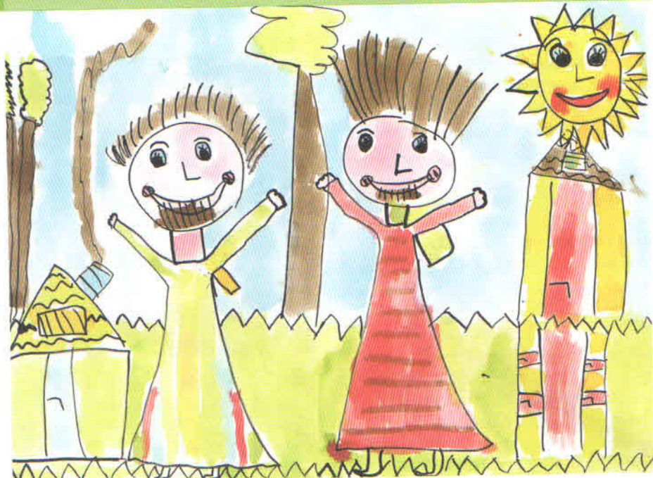
Obrázek z MŠ Zvoneček, Hejnice

Knihka popisuje jednu z cest, jak děti do pohádky zavést, jak s nimi a s pohádkou pracovat, jakou knihu a hru s sebou na tuto cestu vzít. Využívá propojení literární předlohy a metod dramatické výchovy a ukazuje, jak tohoto spojení využít především v mateřské škole.