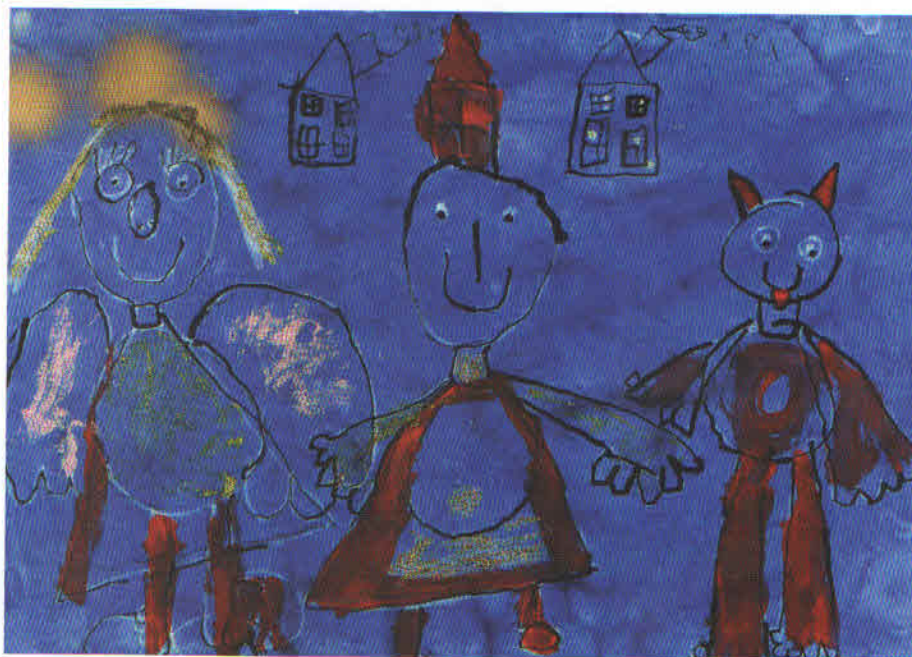
Obrázek z MŠ Pastelka, Milevsko.

Prostředí, ve kterém se dítě vzdělává, a podmínky a přístup podle zastánců