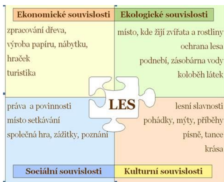
Schéma 1: Čtyři dimenze vzdělávání pro udržitelný rozvoj

Myšlenka udržitelného rozvoje je přes svůj ekonomický a sociální kontext obvykle primárně spojována s ekologií v širokém slova smyslu. Další spojitost s environmentální výchovou, vzděláváním a osvětou (EVVO) lze spatřovat v nositelích vzdělávání pro udržitelný rozvoj, jimiž jsou často titíž lidé, kteří se původně věnovali (a často i nadále věnují) EVVO. Vztah obou konceptů spojuje zájem o životní prostředí, hranice mezi nimi je nejasná a odborníci obhajují různé přístupy. Významnější rozdíl může představovat takový přístup, kdy vzdělávání pro udržitelný rozvoj zastřeší snahu vytvořit školní nebo třídní vzdělávací program cíleně propojující ekologické, ekonomické a sociální aspekty vybrané tematické oblasti.